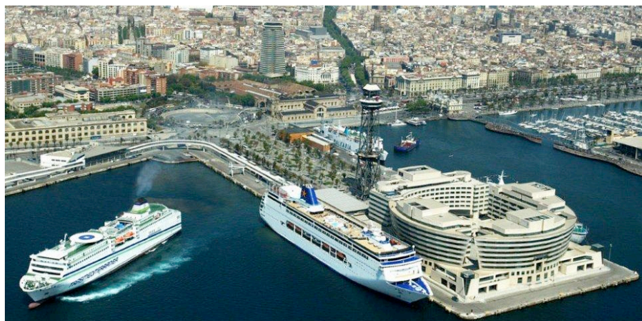
Sede del congreso: World Trade Center (Barcelona)